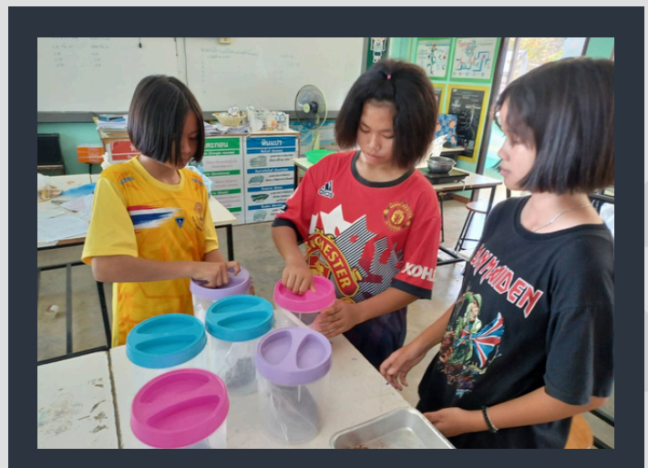
ภาพกิจกรรมขณะนักเรียนทำโครงงานที่สนใจ